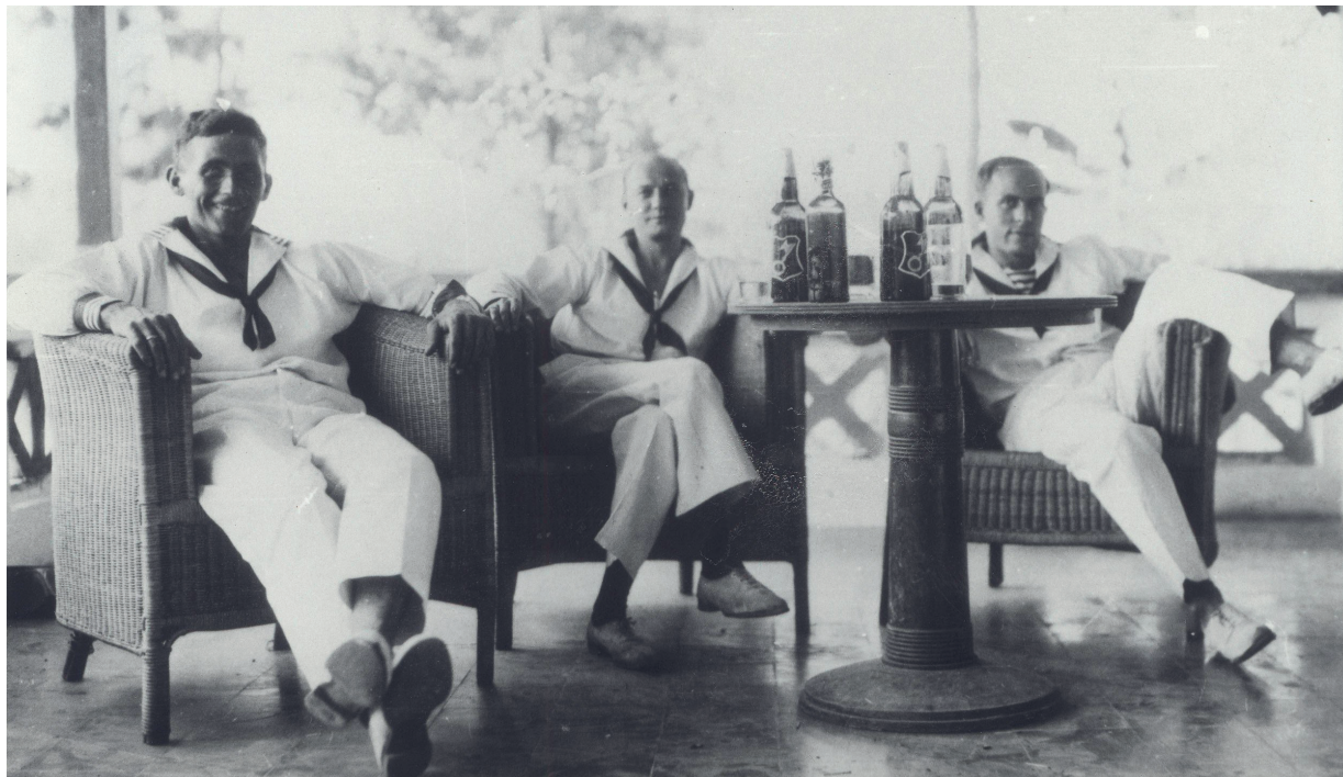
Het Christelijk Militair Tehuis aan de Hofmanstraat in Soerabaja, rond 1926.

en spelen". De christelijke tehuizen wilden echter méér dan dat bieden. Militairen moesten in de tehuizen, in een vreemde omgeving waar de band van kerk, gezin en christelijke traditie ontbrak, een steunpunt hebben waar in christelijke sfeer de vrije tijd kon worden doorgebracht. "Zullen onze Clubhuizen aan hun doel beantwoorden, dan moeten zij, op allerlei wijzen, direct en indirect, spreken van Jezus Christus, onze Heiland en Heer. De blijde boodschap van het Evangelie moet in onze Clubhuizen doorklinken", aldus de CMB. 41