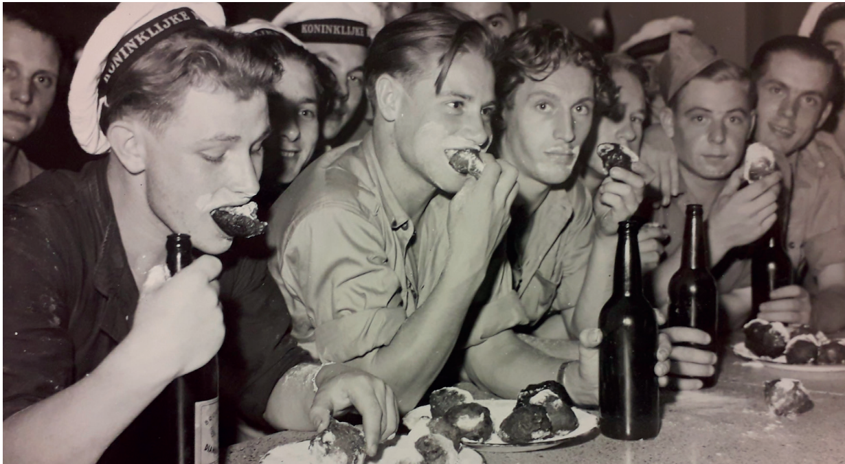
Oliebollen eten in een Katholiek Militair Tehuis, ca. 1948.