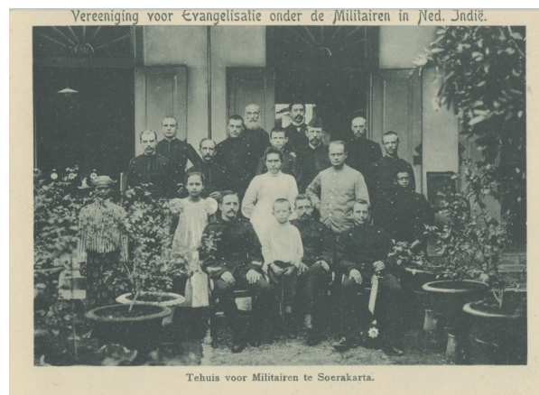
Het tehuis van de Vereeniging voor Evangelisatie onder de Militairen in Ned. Indië in Soerakarta, z.d.

Na het aarzelende begin in 1891, groeide het werk van de Vereeniging snel. Nieuwe evangelist-huisvaders werden uitgezonden en het aantal militaire tehuizen steeg. Ook de inkomsten van de Vereeniging, duizenden gulden werden opgehaald bij Nederlandse burgers, groeiden. Hierdoor konden huisvaders worden aangesteld die zich alléén richtten op de bezoekers van de militaire tehuizen. De groei van het werk betekende wel het verlies van een deel van de oorspronkelijke huiselijkheid. Koffie, thee of sigaren konden door het groeiende aantal bezoekers niet meer gratis worden verstrekt. In 1911, twintig jaar na de oprichting van de Vereeniging, waren