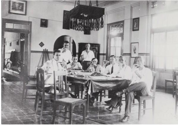
Pannenkoeken eten in het Christelijk Militair Tehuis te Meester Cornelis, 1934.