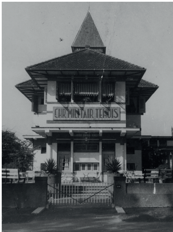
Een Christelijk Militair Tehuis, ca. 1930.

vóór het aanbieden van allerlei ontspanning, gelden als het hoofddoel van de tehuizen. Militairen konden niet alleen lichamelijk of psychisch uitrusten, maar het doel was bij uitstek religieus. Niet voor niets schreef het mededelingenblad: de tehuizen zijn "plaatsen waar de ziel kon rusten". 29