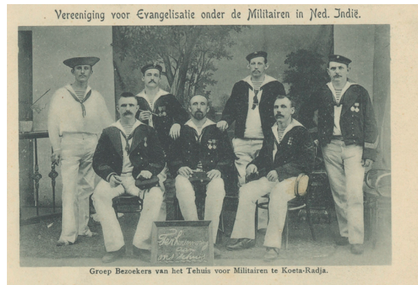
Een groep bezoekers van het Tehuis voor Militairen te Kota Radja, z.d.

In allerhande publicaties van de CMB treffen we vergelijkbare verhalen aan als die van de fuselier die door engelen werd weerhouden om het bordeel te bezoeken. Een ander verhaal vertelt over een vrome militair die het tehuis veelvuldig bezocht om daar op een rustig plekje tot God te bidden om moed voor het overwinnen van zijn angst. In een volgende actie wierp hij zich moedig voorop in de strijd waarin hij werd gedood. 25 De verhalen hadden niet alleen tot doel om op te wekken tot een deugdzaam leven, Bijbellezende en gebed, maar waren eveneens nodig om fondsen te werven om de organisatie draaiende te houden. Naast overheids-